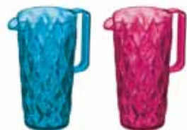
KZ3688-588 4002942202746 T.オリーブ