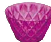
KZ3547-507 4002942241776 T.ピンク