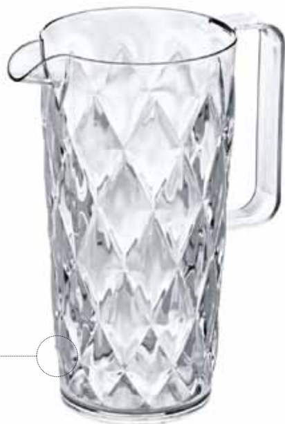
KZ3688-507 4002942240571 T.ピンク