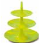
KZ3180-582 4002942193730 S.マスタード