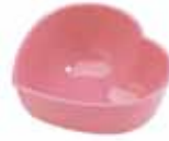
KZ3642-556 4002942121658 S.パプリカム