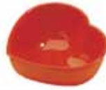
KZ3642-555 4002942121641 S.ストロベリー