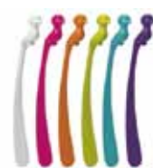
KZ3584-002 4002942210215 S.アソート