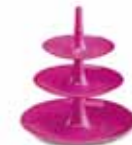
KZ3180-584 4002942193723 S.ピンク