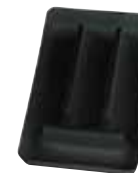
KZ5210-800 4002942197707 S.ブラック