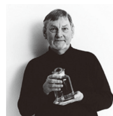
KZ3801-526 4002942179109 S.ブラック