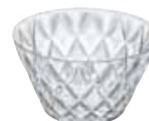
KZ3547-535 4002942241059 T.クリア