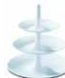
KZ3180-525 4002942090794 S.ホワイト