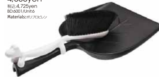
KZ5050-096 4002942205105 ホウキ:S.ホワイト チリトリ:S.ブラック