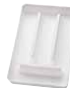
KZ5210-525 4002942187074 S.ホワイト

税込:945yen BD:6001/Unit:8 Materials:Styrolux