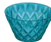
KZ3547-602 4002942241790 T.ラグーン