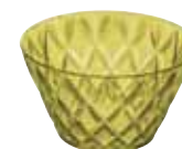
KZ3547-588 4002942241783 T.オリーブ